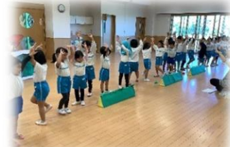
発表会がんばるぞー☆彡