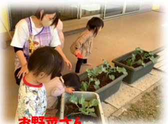
お野菜さん おおきくなあれ!

発表会が終わったら、秋の遠足も待っており、11月は楽しい事が沢山あります。半面、寒くなり、コロナウイルス以外にもインフルエンザや、感染性胃腸炎などの病気も流行り始めますので、健康管理には十分気を付けながら、子ども達と過ごしていきたいと思います。