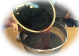
クエン酸をいれて、ざるでこしたら・・・