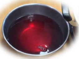
あら、不思議！きれいな赤紫にかわりました。