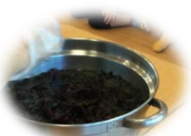
収穫した赤しそを煮詰めて・・・